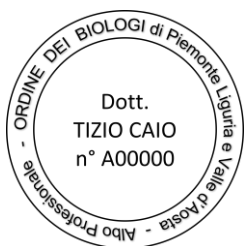
Figura 1: modelli del timbro professionale